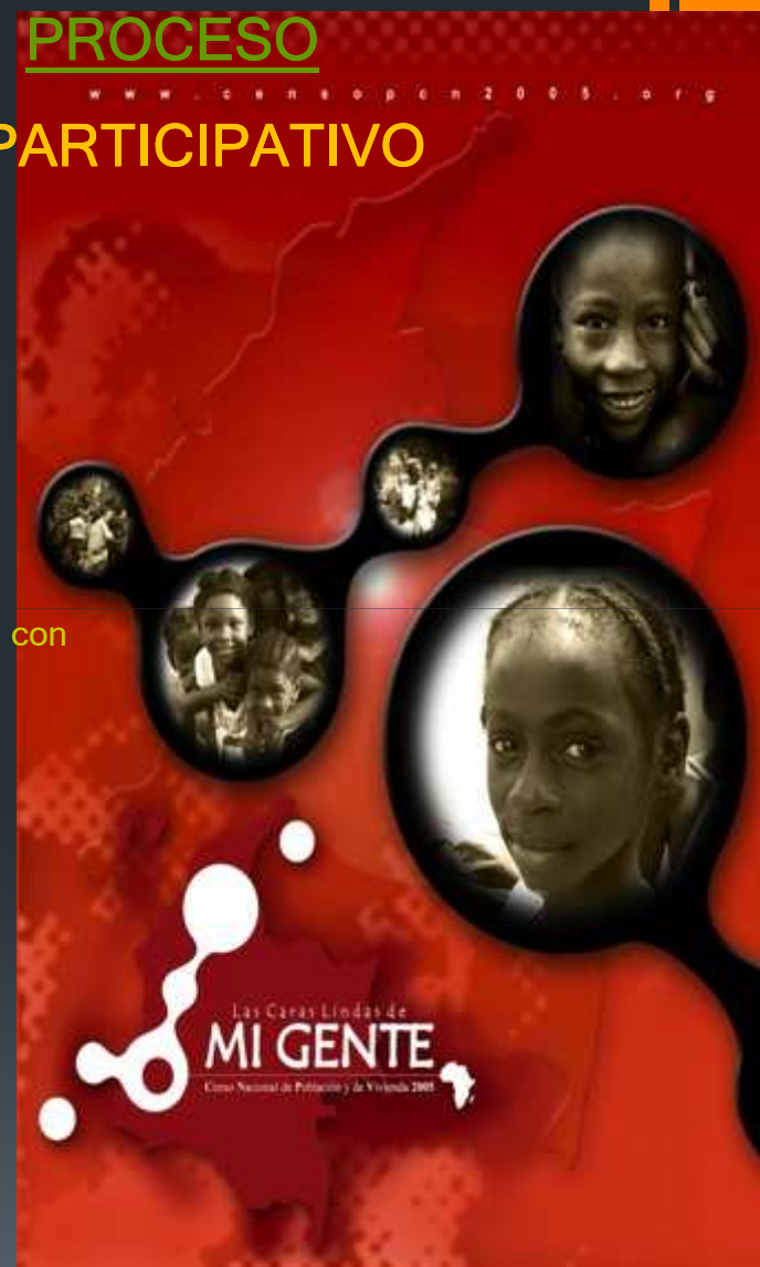
Afiche elaborado por las organizaciones étnicas para las campañas de sensibilización.