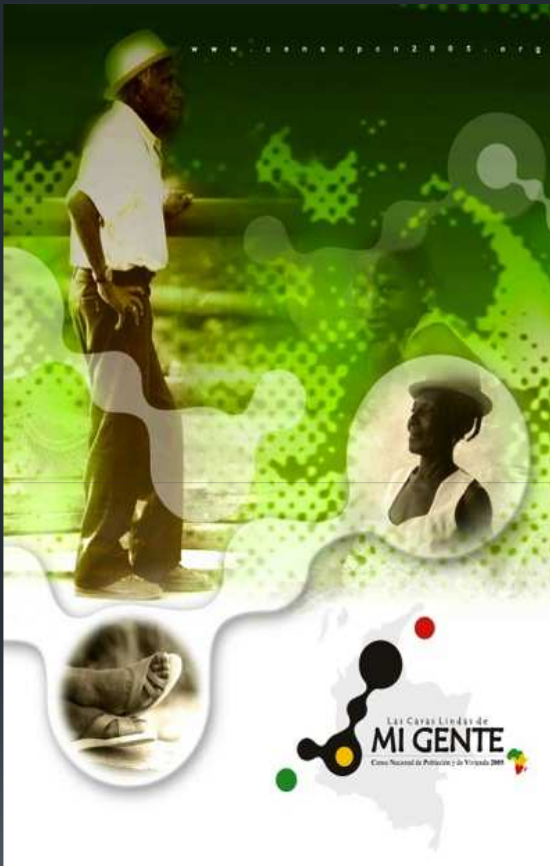
Afiche elaborado por las organizaciones étnicas para las campañas de sensibilización. El Dane (2005) formalizó los derechos de uso, porque no había elaborado material alguno para las comunidades para este propósito.

▪ Para el caso concreto Afrocolombiano el Cuantificar y Caracterizar a los Negr@s, Afrocolombian@s, Raizales y Palenqueros también ha sido un problema; tanto así que existe una gama de legislaciones nacionales e internacionales que demandan al Estado diseñe un sistema de Información Estadístico y Demográfico que de fe de la realidad de esta población.